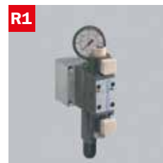
Reg. pressione morse Adjustable vice pressure