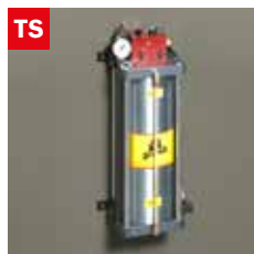
Dispositivo taglio a secco Dry cooling device