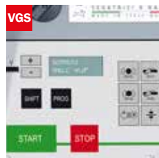
Visualizzatore gradi angolo di taglio Cutting angle display