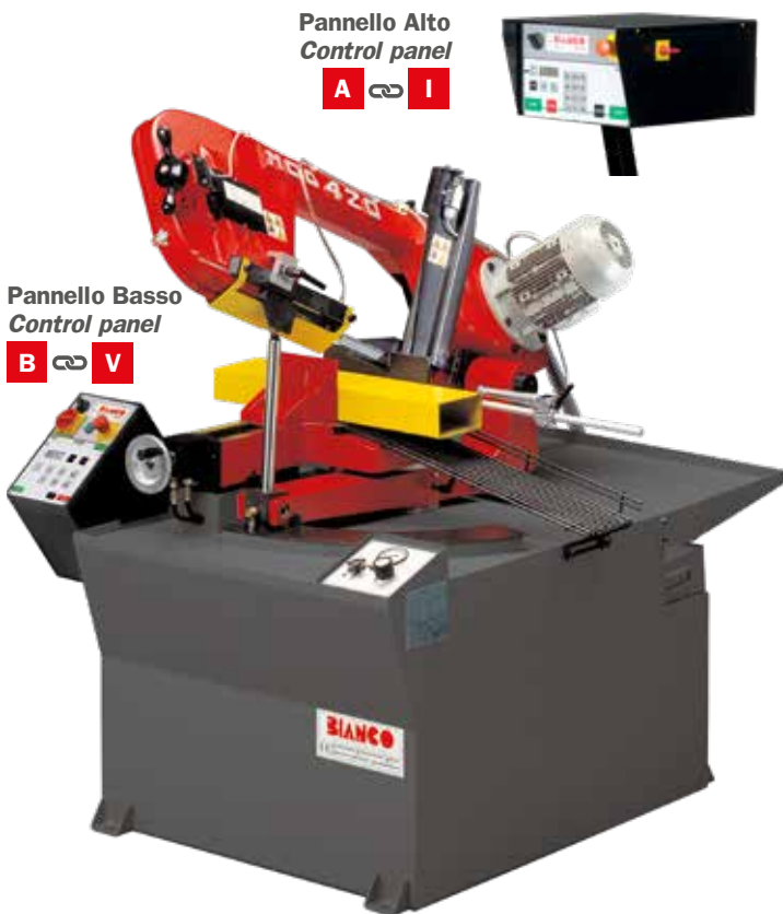
Pannello Alto Control panel