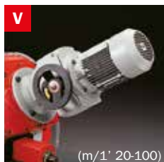
Motovariatore Blade speed variator