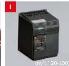
Inverter Frequency converter