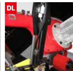
Dispositivo controllo deviazione lama Blade deflection control device