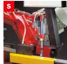
Skip elettrico Electrical skip