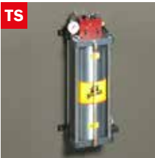
Dispositivo taglio a secco Dry cooling device