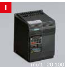
Inverter Frequency converter