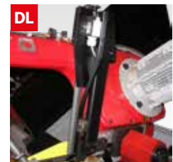
DL Dispositivo controllo deviazione lama Blade deflection control device