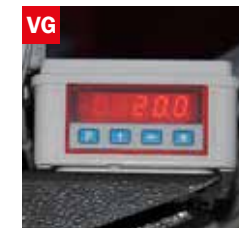
VG Visualizzatore gradi angolo di taglio Cutting angle display