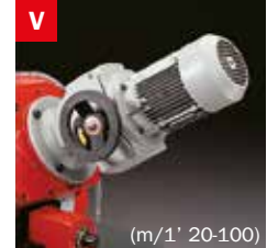
V Motovariatore Blade speed variator (m/1' 20-100)