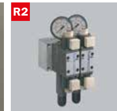
R2 Reg. pressione morse doppio Adjustable vice pressure