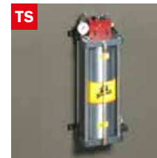
TS Dispositivo taglio a secco Dry cooling device