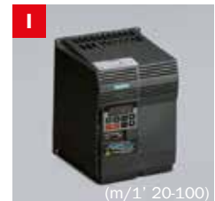
I Inverter Frequency converter (m/1' 20-100)