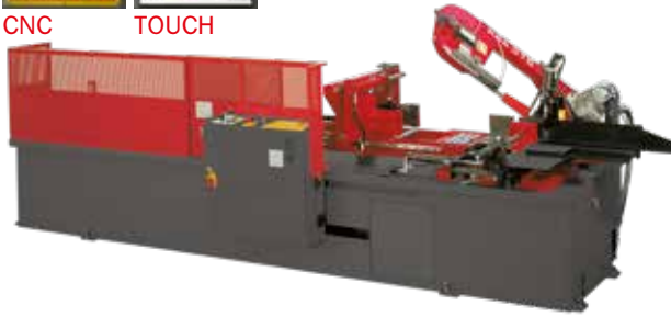
IMMAGINE DIMOSTRATIVA, MACCHINA VENDUTA CON CARTER DI PROTEZIONE COMPLETO. (VEDI MODELLO 370 A DS 1R).

IMAGE FOR DEMONSTRATION PURPOSES ONLY. THE MACHINE WILL BE SOLD WITH ALL THE PROTECTIVE COVERS. (SEE MOD. 370 A DS 1 R PICTURE).