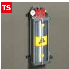
Dispositivo taglio a secco Dry cooling device