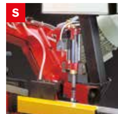
Skip elettrico Electrical skip