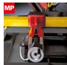
Morsa pneumatica Pneumatic vice