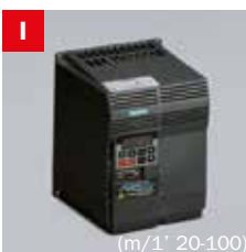
Inverter Frequency converter