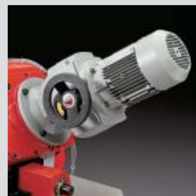
motovariatore blade speed variator