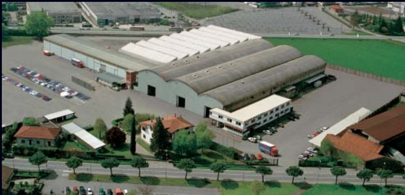
- Carobbio degli Angeli -