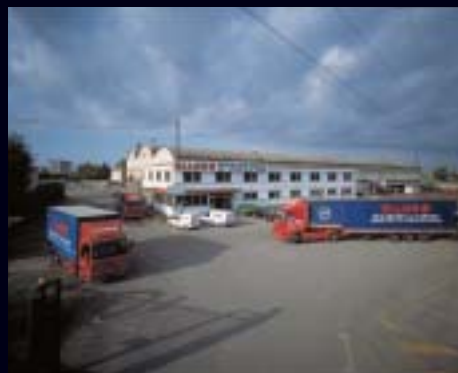
- Carobbio degli Angeli -