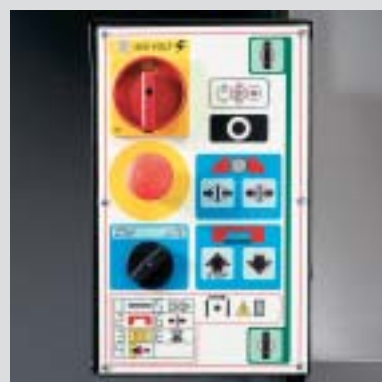
pannello comando control panel