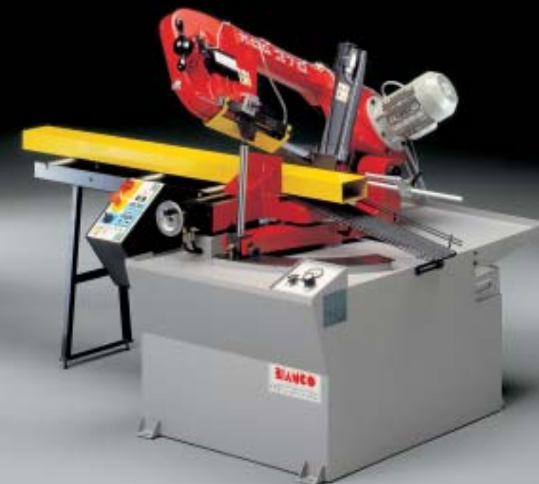
Mod. 370 SA 60°