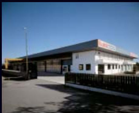
- Bolgare -