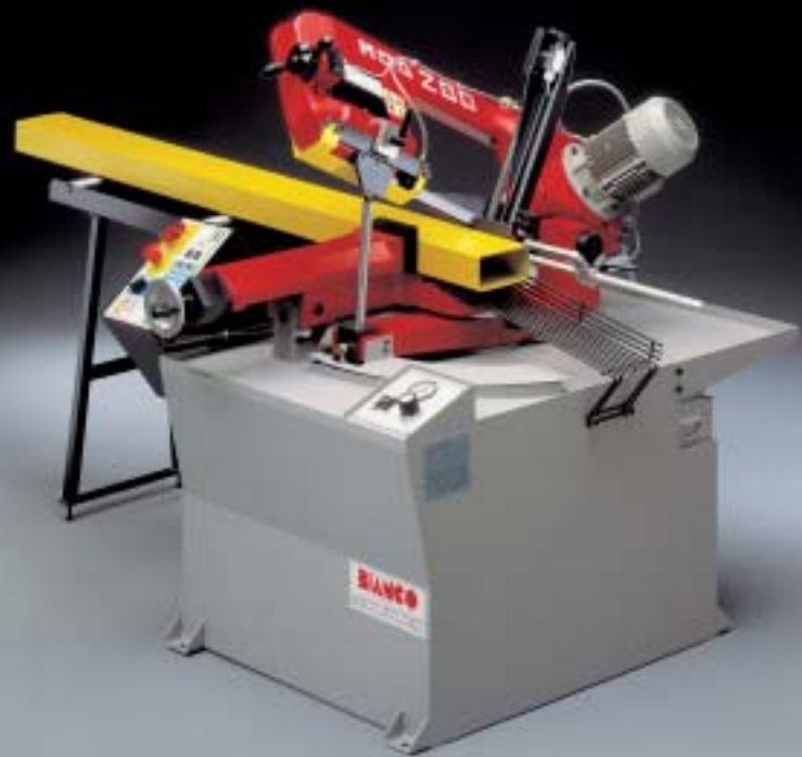
Mod. 280 SA 60°