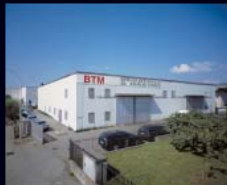
- Torre de' Roveri -