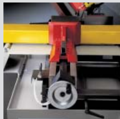
morsa scorrevole sliding vice