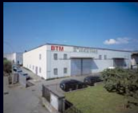
- Torre de' Roveri -