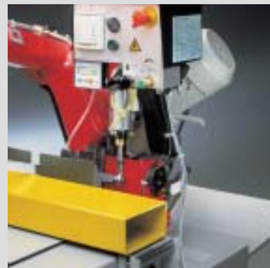
discesa controllata gravity down feed