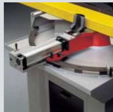
morsa pneumatica pneumatic vice