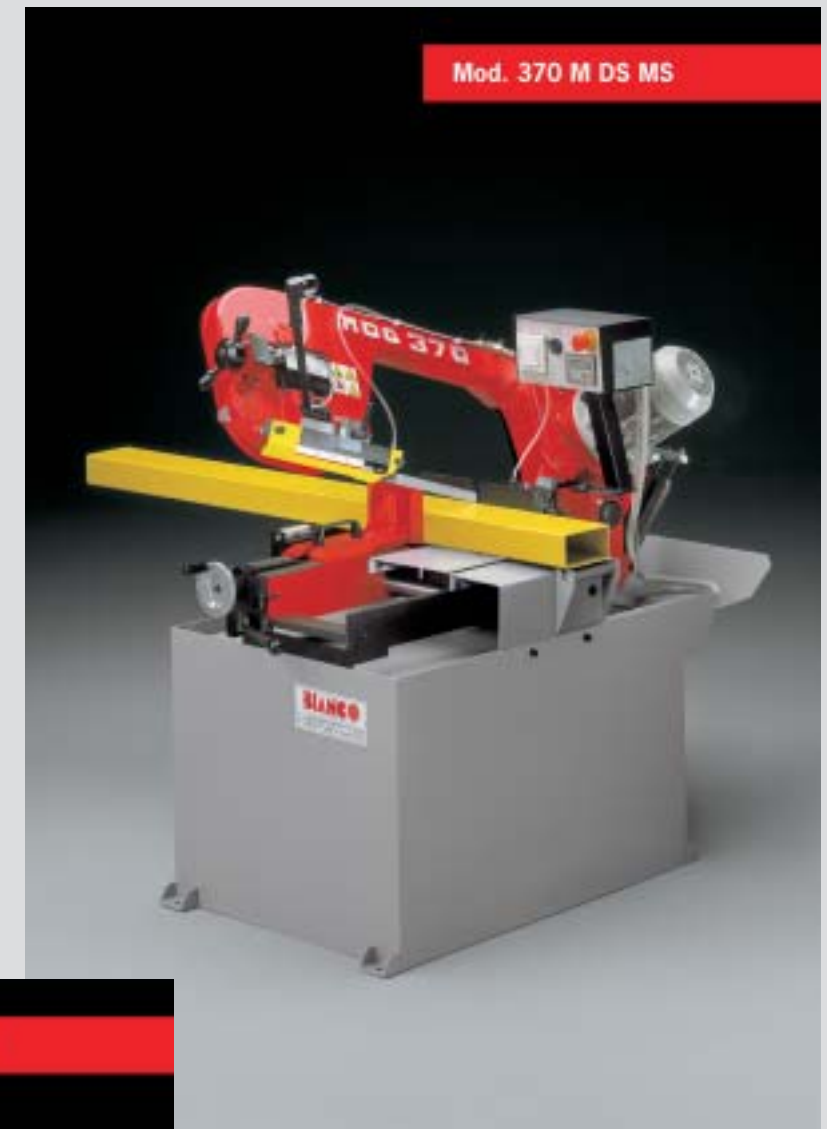
Mod. 370 M DS MS