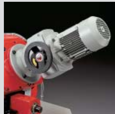
variatore di velocità blade speed variator