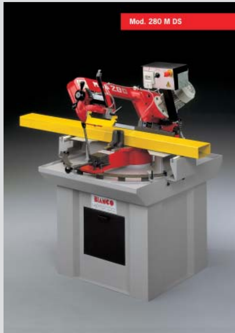
Mod. 280 M DS

Segatrici manuali con possibilità di taglio sia destra che sinistra, complete di riga millimetrata da 500 mm, blocchetto di riscontro, impianto elettrico in bassa tensione secondo norme CE.