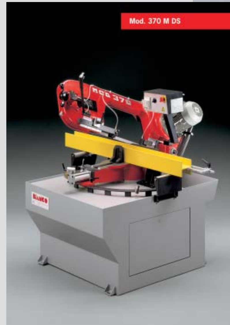
Mod. 370 M DS